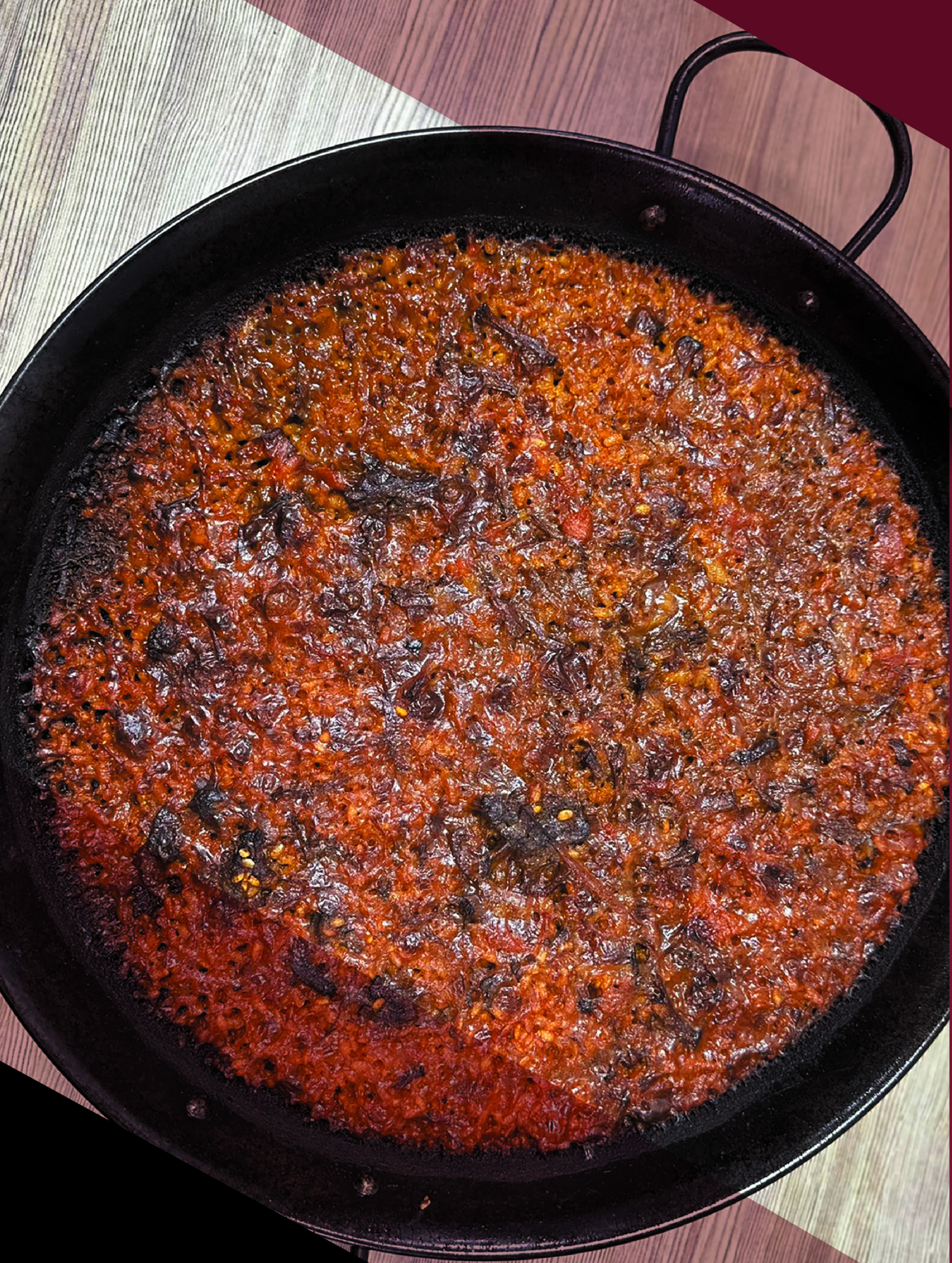
Arroz de Rabo de Toro