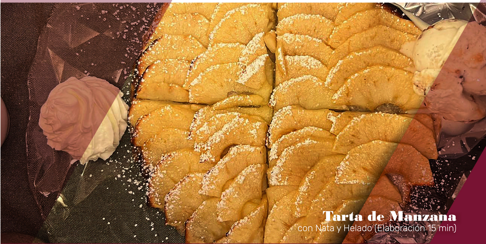
Tarta de Manzana con Nata y Helado (Elaboración 15 min)